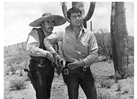
1964 LA RÉCOMPENSE de Serge Bourguignon avec Yvette Mimieux