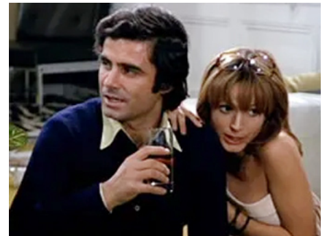
1972 LA GROSSE AFFAIRE (Colpo grosso, grossissimo, anzi probabile) de T. Ricci avec Luciana Paluzzi