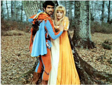
1967 LA CEINTURE DE CHASTETÉ (La Cintura di Castà) de P. Festa Campanile avec Monica Vitti