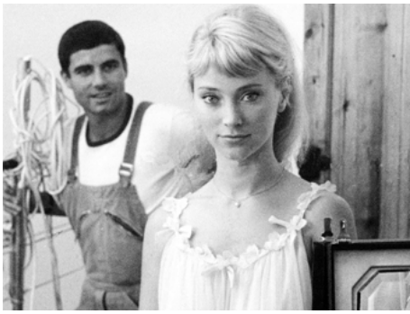
1966 LES CRÉATURES d'Agnès Varda avec Britta Pettersen