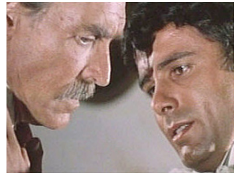
1966 LE TEMPS DU MASSACRE (Tempo di massacro) de Lucio Fulci avec Giuseppe Addobbati