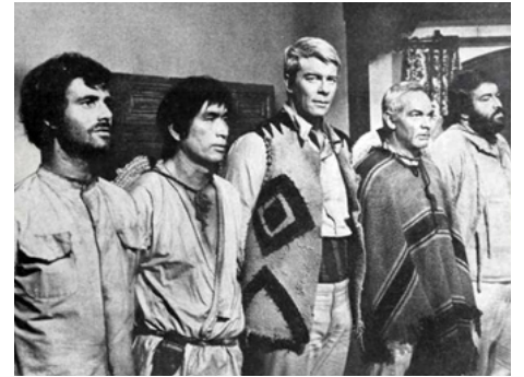
1969 CINQ HOMMES ARMÉS (Un esercito di 5 uomini) d'I. Zingarelli avec T. Tanba, P. Graves, J. Daly, B. Spencer