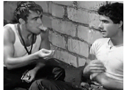
1963 VIOL À L'ITALIENNE (La Smania addosso) de Marcello Andrei avec Gérard Blain