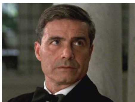
1996 LE PATIENT ANGLAIS (The English Patient) d'Anthony Minghella