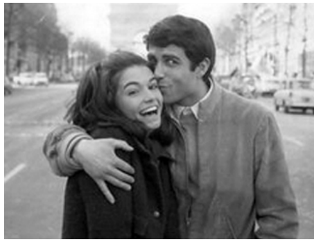
1966 UN MONDE NOUVEAU (Un mondo nuovo) de Vittorio De Sica avec Christine Delaroche