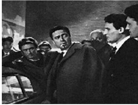
1960 FLAGRANT DÉLIT (La Garçonnière) de Giuseppe De Santis avec Raf Vallone