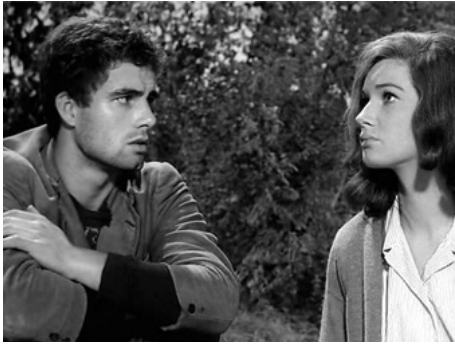
1960 LA GRANDE PAGAILLE (Tutti a casa) de Luigi Comencini avec Carla Gravina