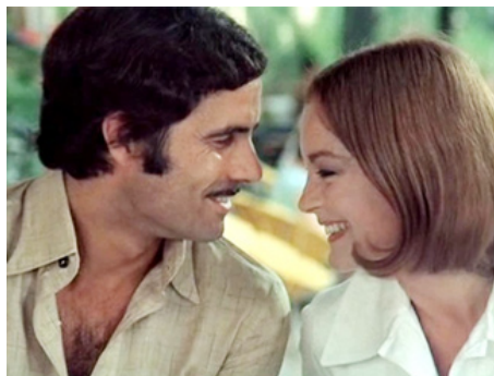
1974 UN AMOUR DE PLUIE de Jean-Claude Brialy avec Romy Schneider