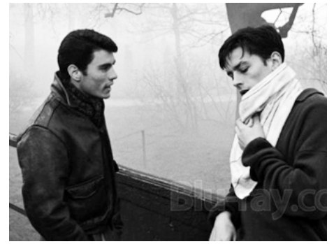
1960 ROCCO ET SES FRÈRES (Rocco e i suoi fratelli) de Luchino Visconti avec Alain Delon