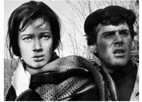
1960 LES PARTISANS ATTAQUENT À L'AUBE (Un giorno di leoni) de Nanni Loy avec Carla Gravina