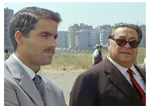
1965 À L'ITALIENNE (Made in Italy) de Nanni Loy avec Aldo Fabrizi