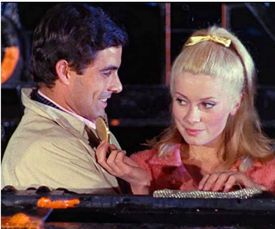
1964 LES PARAPLUIES DE CHERBOURG de Jacques Demy avec Catherine Deneuve