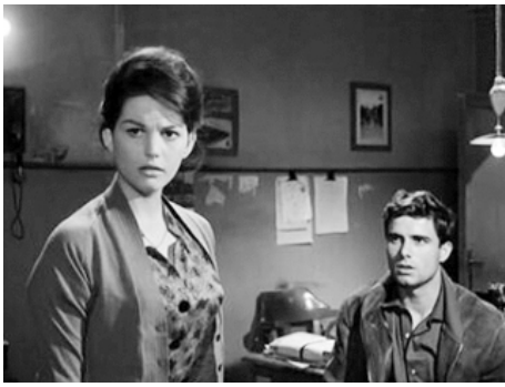
1959 MEURTRE À L'ITALIENNE (Meledetto imbroglia) de Pietro Germi avec Claudia Cardinale