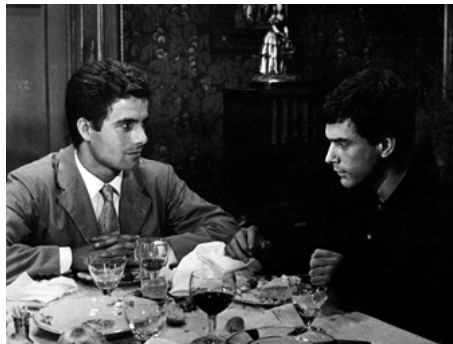
1961 JOUR APRÈS JOUR (Giorno per giorno) d'Alfredo Giannetti avec Tomas Milian