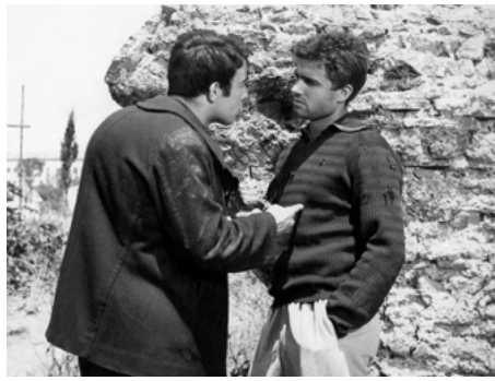
1960 LE BOSSU DE ROME (Il Gobbo) de Carlo Lizzani avec Gérard Blain