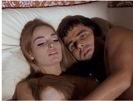
1969 LA SCANDALEUSE (Salvare la faccia) de Rossano Brazzi avec Adrienne La Russa